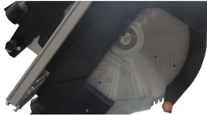
Unité de coupe au carbure 01