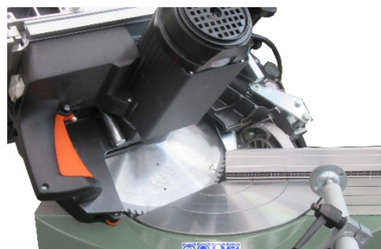
Palette supérieure de coupe 05