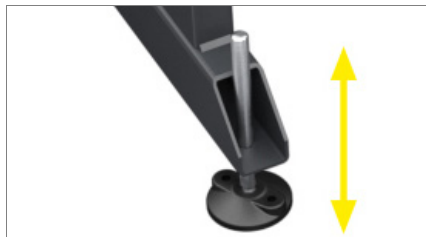
Verstelbare pootjes 01