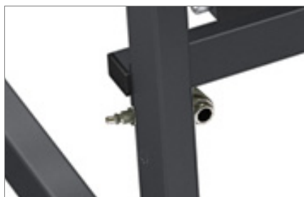
Uitschuifbaar en in hoogte verstelbaar steunvlak 05