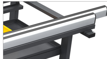
Blad van antislip pvc 02