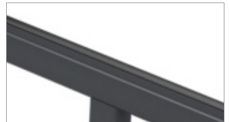
Blad van antislip pvc 02