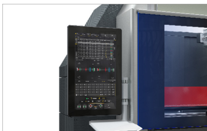
Pneumatische aanslagen 05