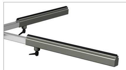
Uppläggningsyta med PVC -skydd