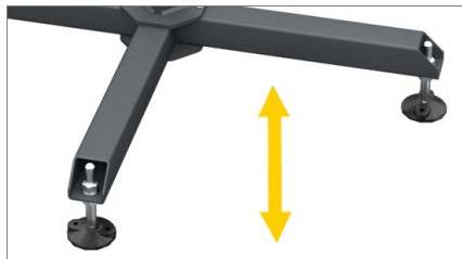
Ställbara benstöd 01