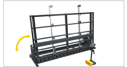
Table de travail basculant 02