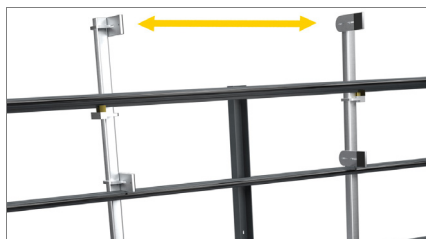
Fastspänning av ramen 01