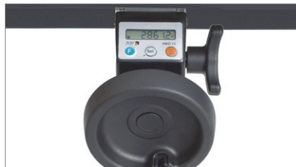
Lector digital VIS 01