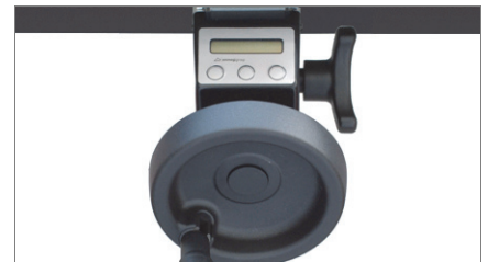
Lector digital MV 02