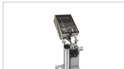
Avvitatura autoalimentata 02