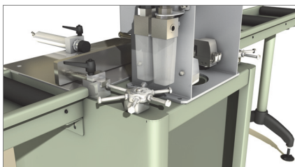
Posizionamento del profilo 01