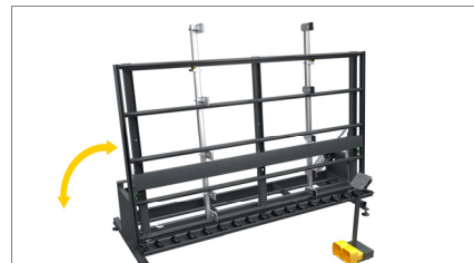
Piano di lavoro ribaltabile 02