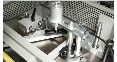
Groep bankschroeven en schuinhoeken 02