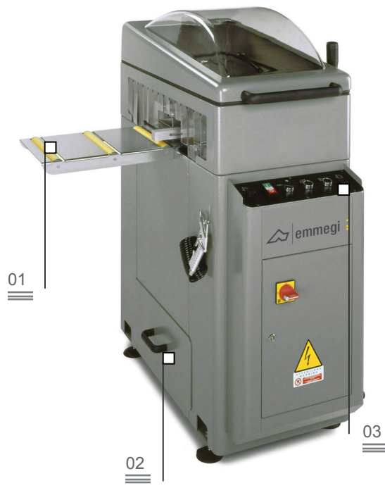
Cajón recoge virutas 02

Las tecnologías complementarias cumplen un papel importante en el taller porque la gama de productos cuenta con instrumentos estudiados para satisfacer especiales exigencias. Para el fresado, taladrado, retestado, limado, posicionamiento de perfiles y tope de medida, Emmegi ofrece una amplia gama de máquinas adecuadas. Lilliput 320 M es una fresadora retestadora horizontal con avance manual. Fresado fuera escuadra (+45°/90°/-45°). Alta velocidad de rotación de la herramienta: de esta manera, mejora la calidad de mecanizado en el perfil lacado y fuera escuadra. Cambio rápido del grupo de fresado con mando neumático. Plano de apoyo perfil antirrayas. Zona de mecanizado protegida integralmente y con gran visibilidad interna.