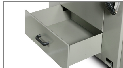
Opvang spaanders 02