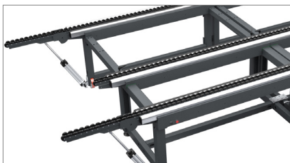
Piano a scomparsa