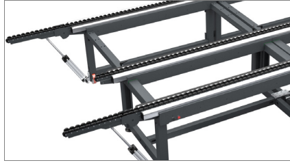
Açılır kapanır çalışma yüzeyi