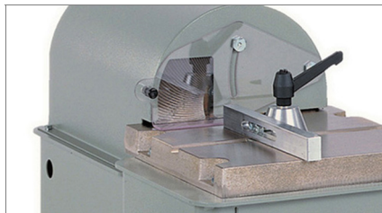
Protecteur du disque