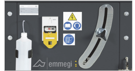
Escala graduada 02