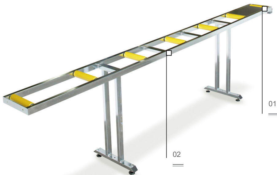
Table à rouleaux

Structure tubulaire en acier munie de pieds réglables: équipée de rouleaux de 240 mm, la longueur du chemin d'aménagement atteint 3500 mm; dotée de rouleaux de 440 mm, sa longueur est de 4000 mm.