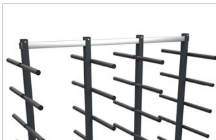
Ayarlanabilir merkezi dayanaklar 03

Üretim devresinin rasyonel ve mükemmel hale getirilmesinde, gerek montaj safhasında yarı işlenmiş, gerek bitmiş ürün olsun malzemenin düzgün bir şekilde akımının tasarımının rolü son derece önemlidir. Emmegi'nin lojistik hattı firmaların tüm depolama, hareket ve montaj gereksinimlerine somut bir yanıt vermektedir. Stack profillerin yatay olarak taşınması ve istiflenmesinde kullanılan bir arabadır.