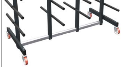
Ekseni etrafında dönen tekerlekler 01