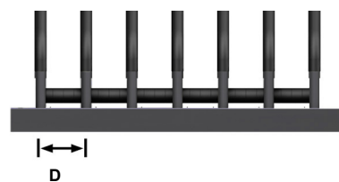
Рольганг скольжения с запором

Transit Kt - это телега для транспортировки и складирования каркасов и готовых рам. Несущее основание оборудовано роликами, упрощающими загрузку/выгрузку тяжелых или больших каркасов.