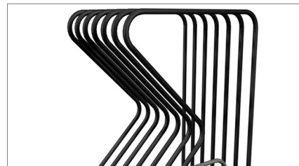
Боковые контактные поверхности