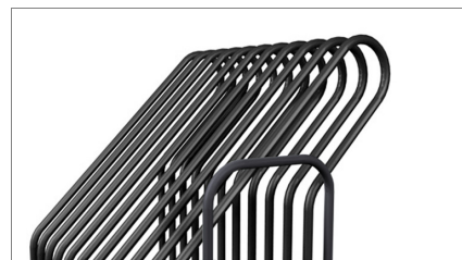
Superfícies de contato