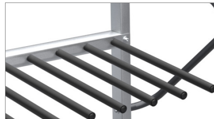
Superfici di contatto 02