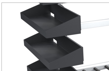
Contenitori laterali 03

Le immagini sono riportate solo a scopo illustrativo