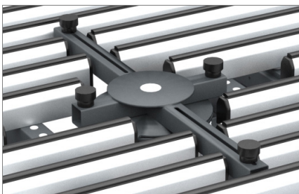
Patas ajustables 05