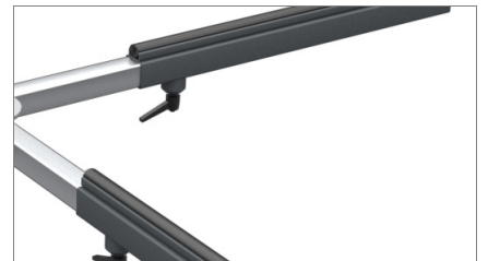
Plano antideslizante en PVC 02