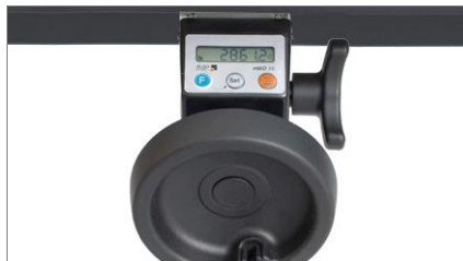
Afficheur numérique VIS 01