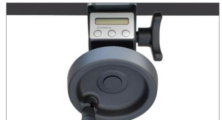
Afficheur numérique MV 02