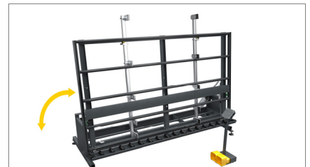
Kippbare Arbeitsfläche 02