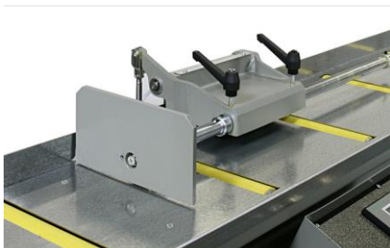
Lector de códigos de barras (opcional) 05