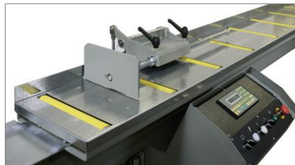
Vista lateral 01