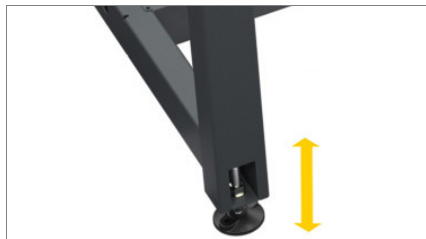
Piedini regolabili 01