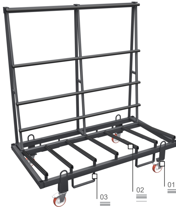
Piano in PVC antiscivolo 02

Nella razionalizzazione e ottimizzazione del ciclo produttivo svolge un ruolo importante la progettazione di un corretto flusso dei materiali, siano essi semilavorati, particolari in fase di montaggio o prodotti finiti. La linea Logistica di Tekna offre alle aziende una concreta risposta a tutte le esigenze di stoccaggio, movimentazione e assemblaggio.